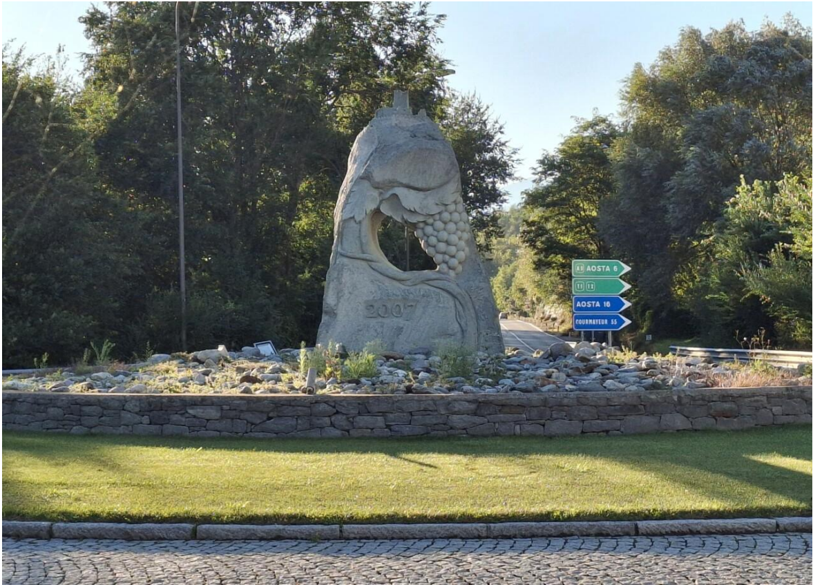
Fig. 3: Robert Cavorsin, rotatoria stradale Chambave 2007, SS26 Valle d'Aosta