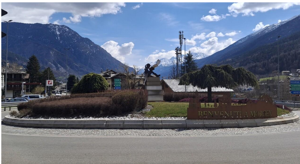
Fig. 2: Laëtitia-May Le Guélaff, rotonda stradale con una bambina che legge, SS26 Valle d'Aosta