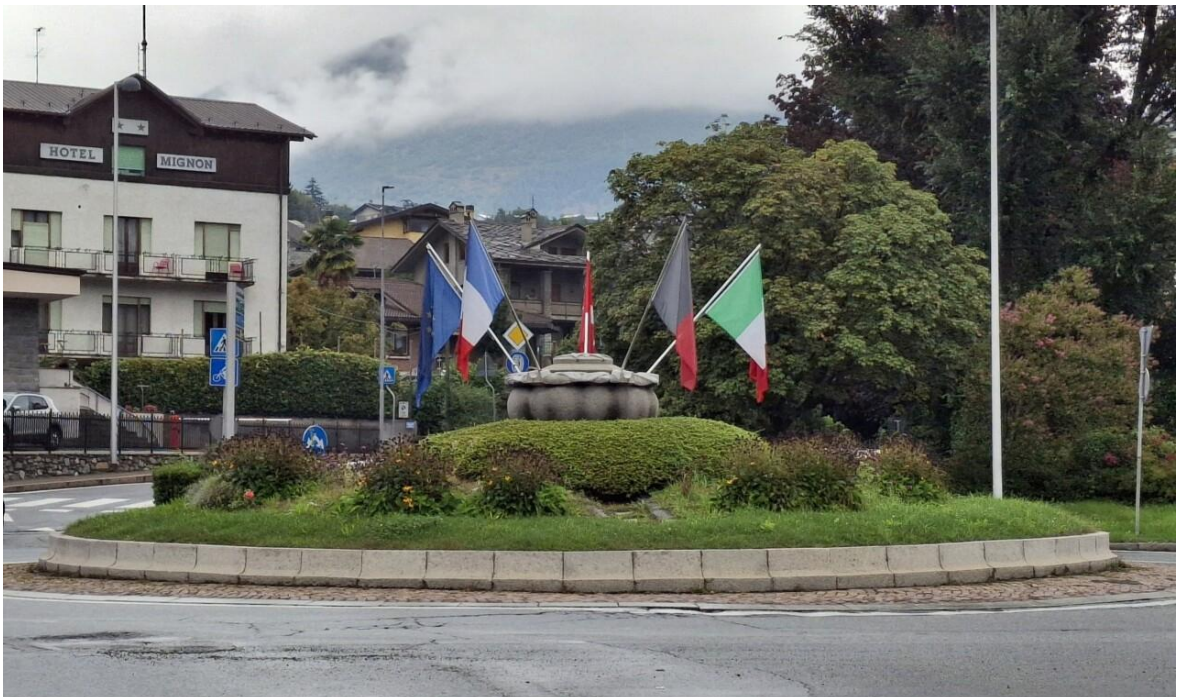
Fig. 4: Rotatoria stradale con coppa dell'amicizia ad Aosta